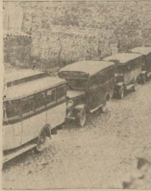
Şehir otobüslerinden birkaçı

vessül edilmiş olan otobüs işletme imtiyazının dahi akim kaldığı yine bazı gazetelerin neşriyatından anlaşılmaktadır. Halbuki 15 Temmuz 934 tarihli resmi gazete de neşredilen 9/7/934 tarih 2571 sayılı kanun mucibince belediye sınırı dahilinde muayyen mntakalar arasında yolcu nakil vasıtası olarak otobüs, ominbüs, otokar işletmek hakkı münhasıran belediyelere verilmiş olduğundan mevzuubahs imtiyaz teşebbüsünün akameti hakkındaki neşriyat doğru değildir.