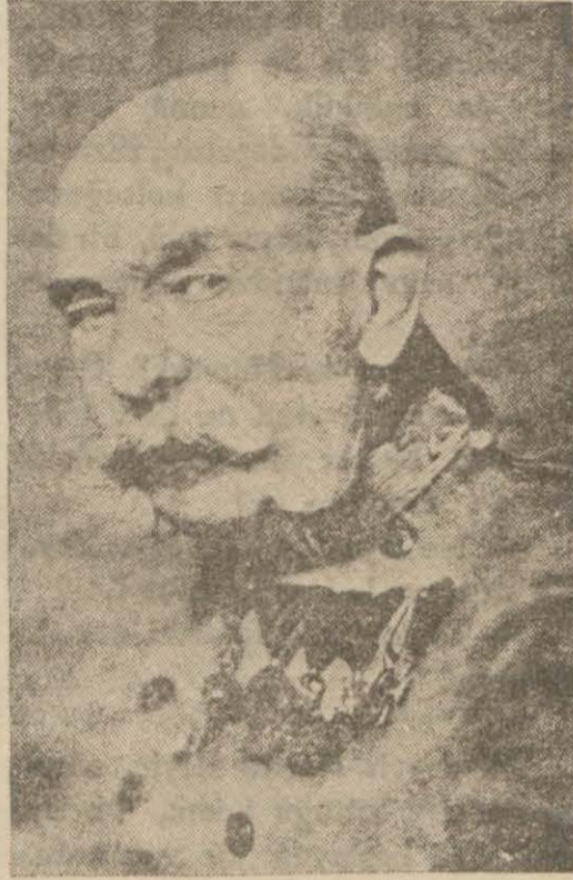
Müttefik hükümdarlarından: Avusturya Imperatoru ve Macar kralı Fransuva Jozef

Cidden kıymetli bir harp silâhı olan (Goben) zırhlısının adı (Yavuz), ondan küçük olan kruvazörün ismi de (Midilli)