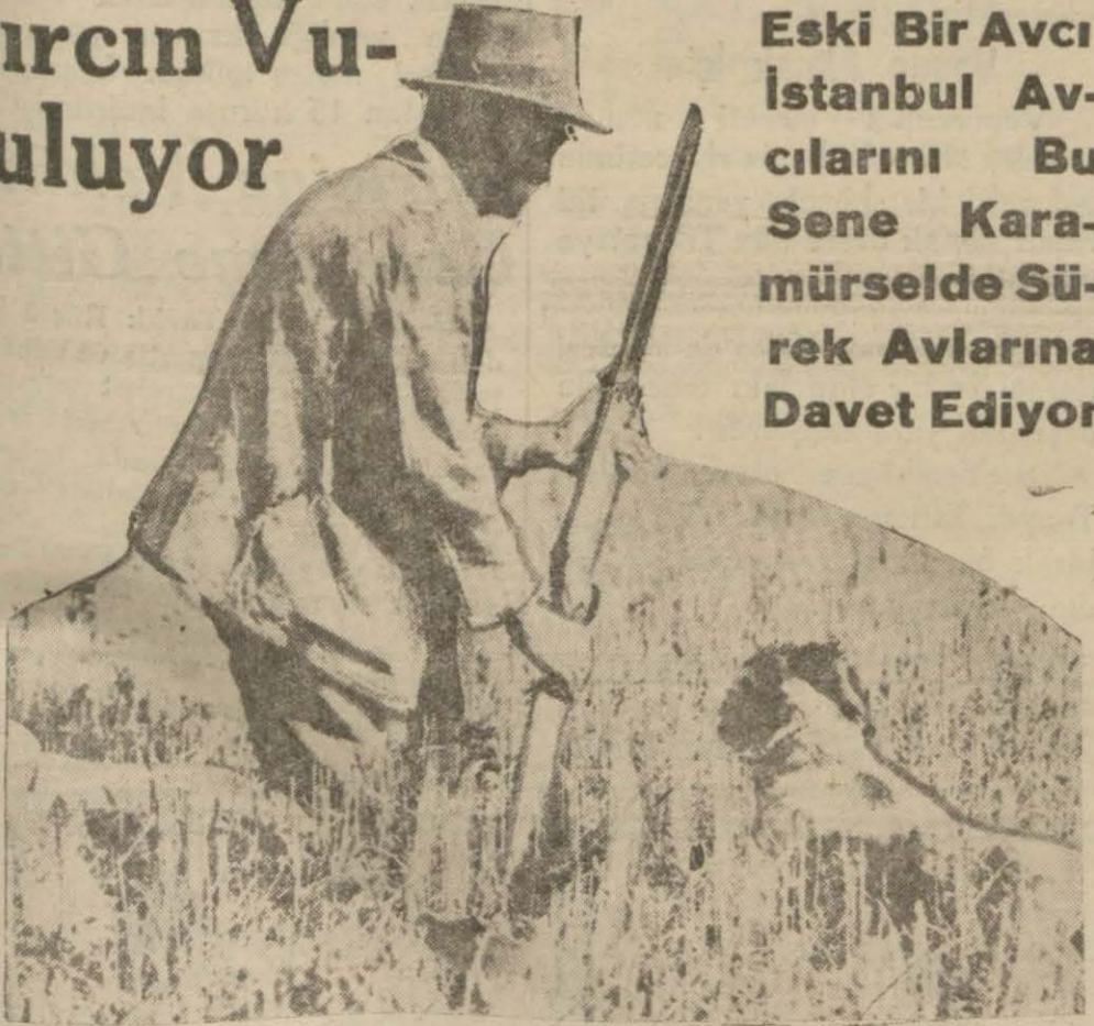
Hegecanlı bir bekleşiş

Eski Bir Avcı İstanbul Avcılarını Bu Sene Kararmürselde Sürük Avlarına Davet Ediyor