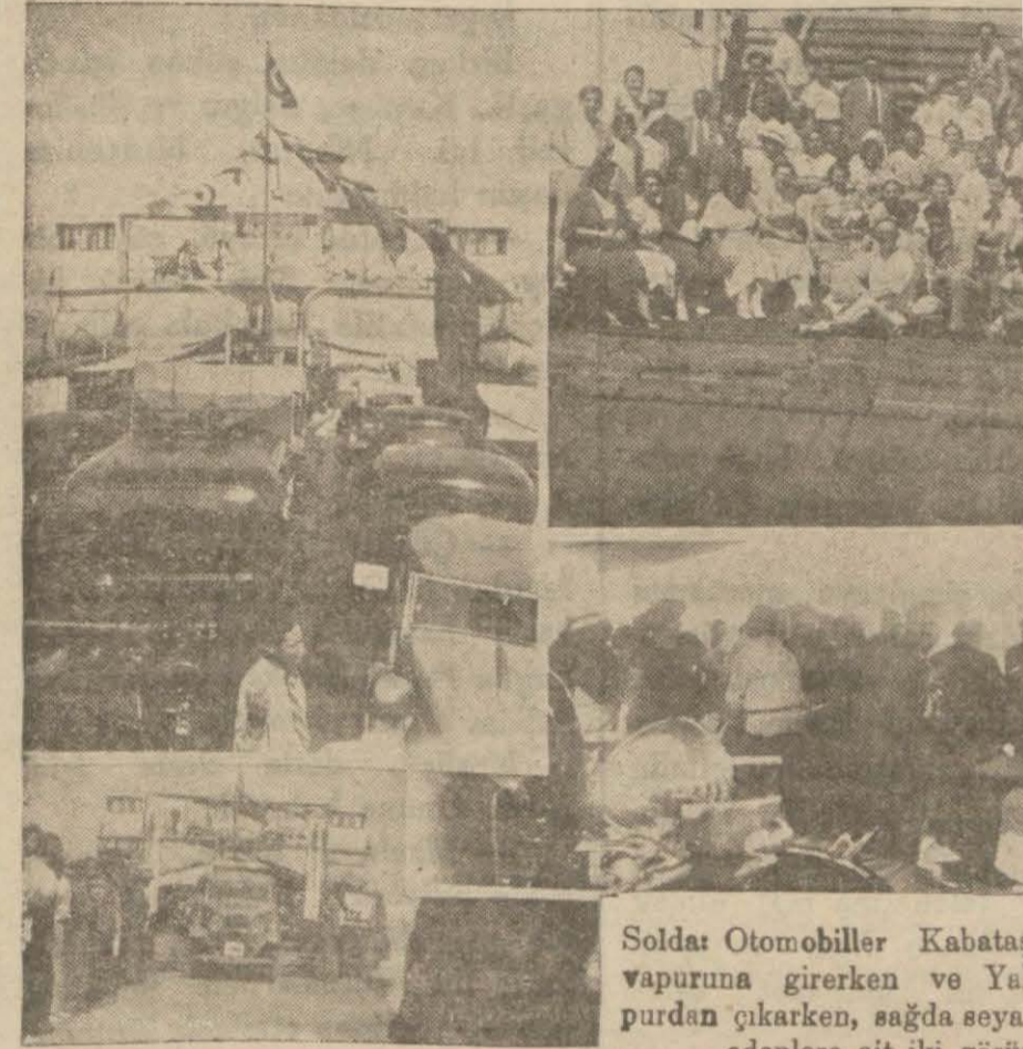
Solda: Otomobiller Kabataş vapuruna girerken ve Yalovadan çıkarken, sağda seyahat edenlere ait iki görünüş.

23 Otomobilli Bu Asrî Kervan metreleri Bir Lokmada Yutuyor